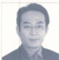
東京区議会議員 大塚たかあき