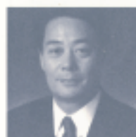
前区議会議員 海江田万里